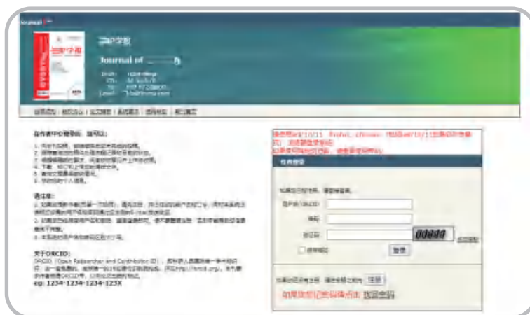
(a) 正规期刊官方网站“在线投稿”跳转到的独立的投审稿系统示例

假网站以获得作者联系信息为目标，一般不配置独立的投审稿系统。如图3所示假网站，投稿界面极其简单，只需填写联系方式和稿件名称，提交文档即完成投稿过程。