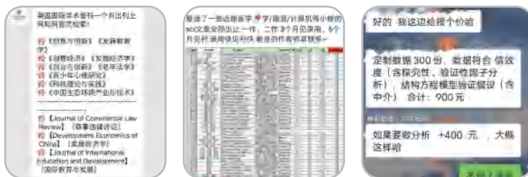
图6 部分不合规的第三方服务示例