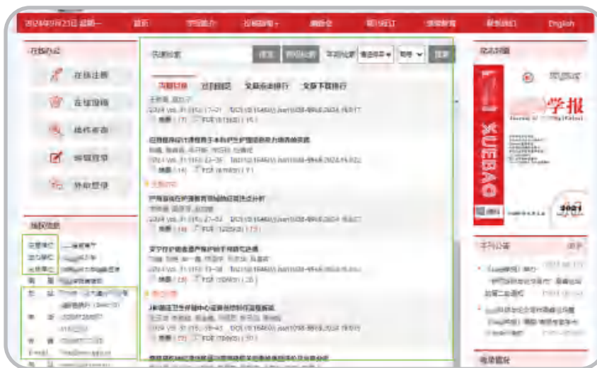
(a) 正规官方网站不突出广告（或无广告）示例

广告，广告内容以突出与个人相关的利益吸引投稿为主。如图2 (b) 所示假网站，核心位置显示“为您晋升职称、毕业论文提供专业服务”，并在显要位置开辟“录用公告”滚动“已录用”信息。这些诱导作者投稿的广告通常不会出现在正规网站上。