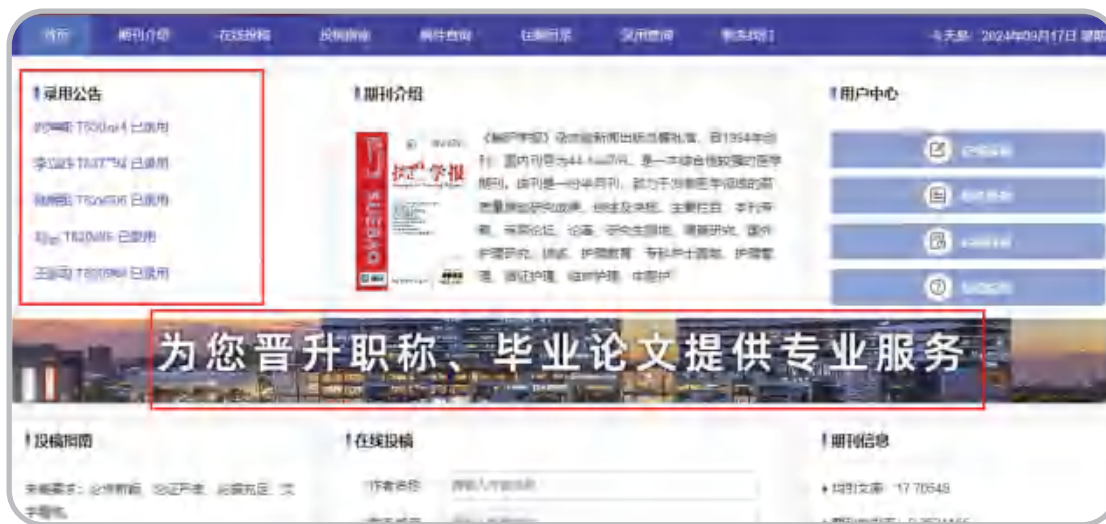
(b) 假网站突出显示广告内容示例