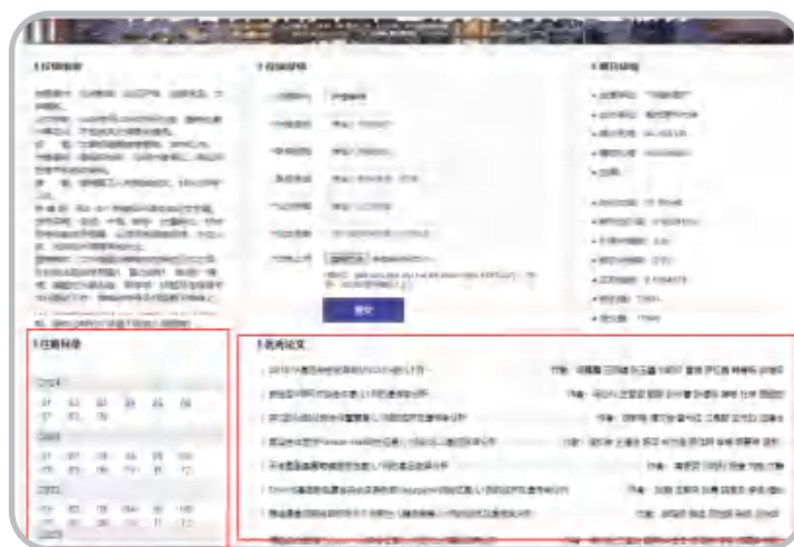
图3 假网站文章内容示例

假网站所展示的文章通常不会设置栏目、卷期、高被引等标签分类，所列文章通常不附带题录信息，也无法在声明的收录数据库中查询到。如图3所示假网站在网页最下方显示文章信息，文章通排不分类，左侧虽列有卷期，但点击每期跳转后内容展示完全一样，网站所列文章在其收录数据库中均无法查到。