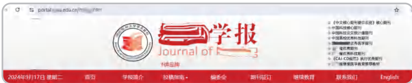
(a) 正规官方网站域名示例