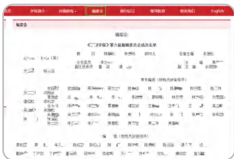
图4 官方网站的“编委”信息示例

假网站通常缺少编委信息，以减少被检索而受审查的风险。假网站也存在列举少数编委，且所列编委团队与期刊学术水平不匹配、编委成员与期刊所属领域关联不强等。如图2 (b) 所示假网站，无编委相关内容。