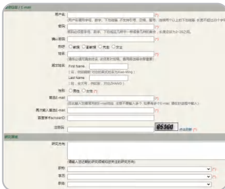
(b) 正规期刊的投审稿系统需要填写完备详实的个人及稿件信息